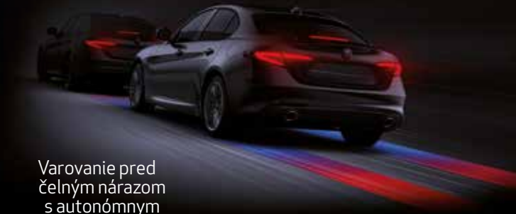
Varovanie pred čelným nárazom s autonómnym núdzovým brzdením