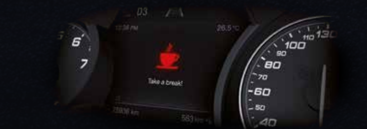
Systém sledovania pozornosti vodiča