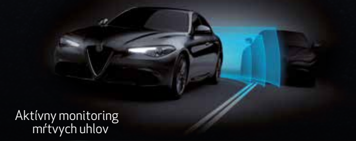
Aktívny monitoring mŕtvych uhlov