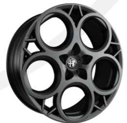
20" disky z ľahkých zliatin (pneu 235/40 R20)