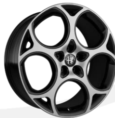
19" disky z ľahkých zliatin (pneu 235/45 R19)