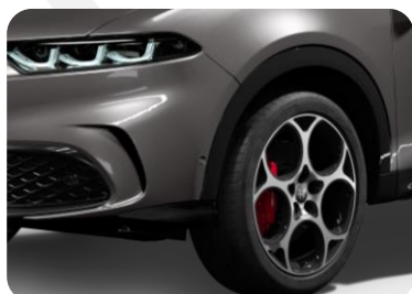
19" disky z ľahkých zliatin